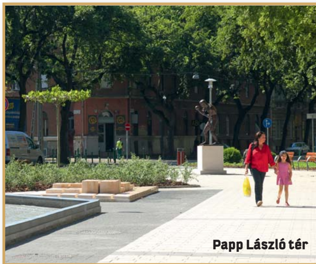
Papp László tér

✓ A Klapka Szolgáltatóház építési engedélye birtokában az épület bontása megtörtént, megindult a kivitelezési közbeszerzési eljárás.