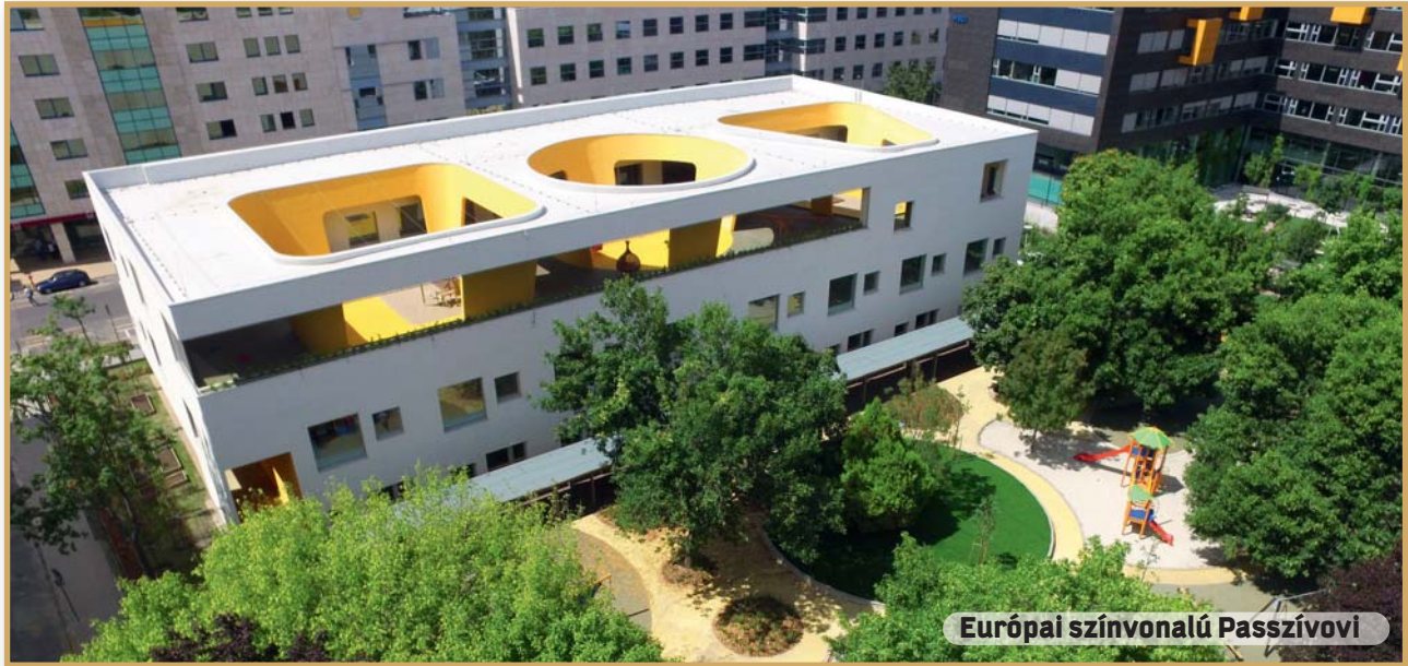
Európai színvonalú Passzívovi