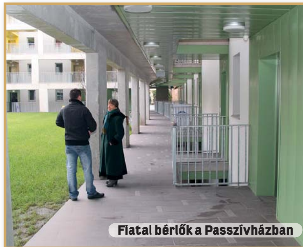
Fiatal bérlők a Passzívházban