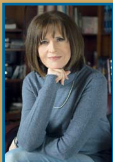
Koncz Zsuzsa előadóművész