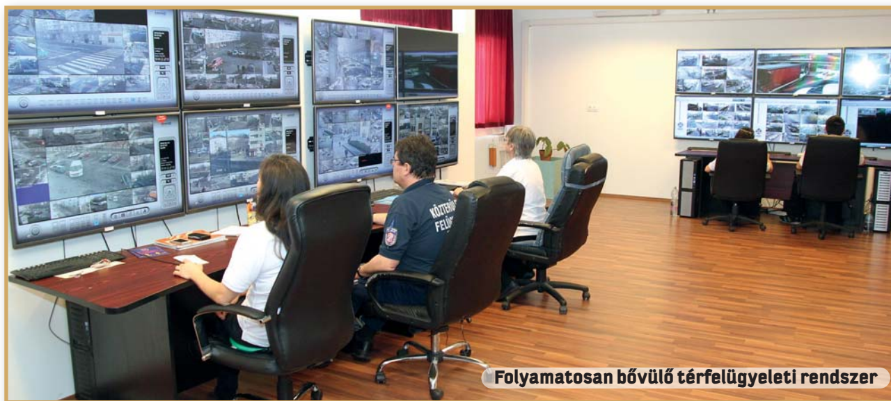
Folyamatosan bővülő térfelügyeleti rendszer