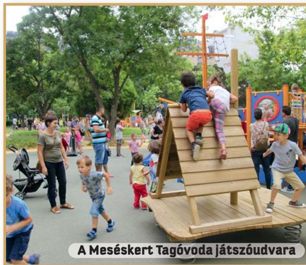
A Mesés kert Tagóvoda játszóudvara

✓ Az óvodai férőhelyek száma ebben az évben 196-tal bővült. Kerületünkben valamennyi óvodáskorú gyermek elhelyezése biztosított.