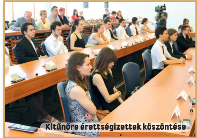
Kitűnőre érettségizettek köszöntése

Fontosnak tartom, hogy nemcsak az intézmények működtetéséről gondoskodik az önkormányzat, hanem sokszínű és személyre szabott továbbképzési lehetőségeket is biztosít az ott dolgozó pedagógusoknak.