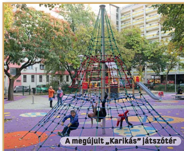
A megújult „Karikás” játszótér

✓ Októberben a Karikás név került a bejáratra az Árpád hídfő lakótelepen lévő, teljes mértékben felújított, az európai előírásoknak megfelelő játszótérre. A beruházás 78 millió forintba került. Területe 292 m 2 -ről 450 m 2 -re növekedett. A felújítás során a játszótéren 7 új játszóeszközt helyeztek el, és közel 500 m 2 egyedi mintás gumiburkolatot alakítottak ki.