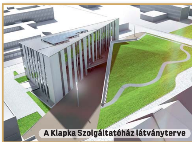
A Klapka Szolgáltatóház látványterve