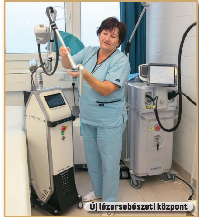
Új lézersebészeti központ