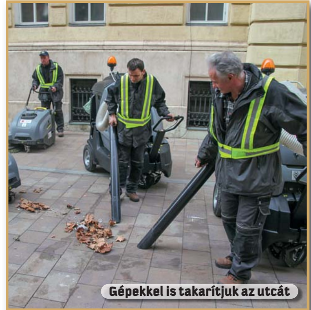
Gépekkel is takarítjuk az utcát

– Örömmel tapasztaljuk, hogy a kerületi önkormányzat stratégiai kérdésként kezeli a környezet- és a szemléletformálás ügyét. A kerületi szolgáltatások hatékony üzemeléséhez és a kerület tisztaságához, rendezettségéhez nagyban hozzájárul a hatékony kommunikáció és a szemléletformálás. Sokszor csak annyi információ hiányzik a tudatos lakosnak, hogy „mit-hova-miért”, s ha ezt jókor, jó csatornán juttatjuk el hozzá, akkor megnyertük a tiszta kerület élharcosának. A Zöld Pont erre egy tökéletes lehetőség!