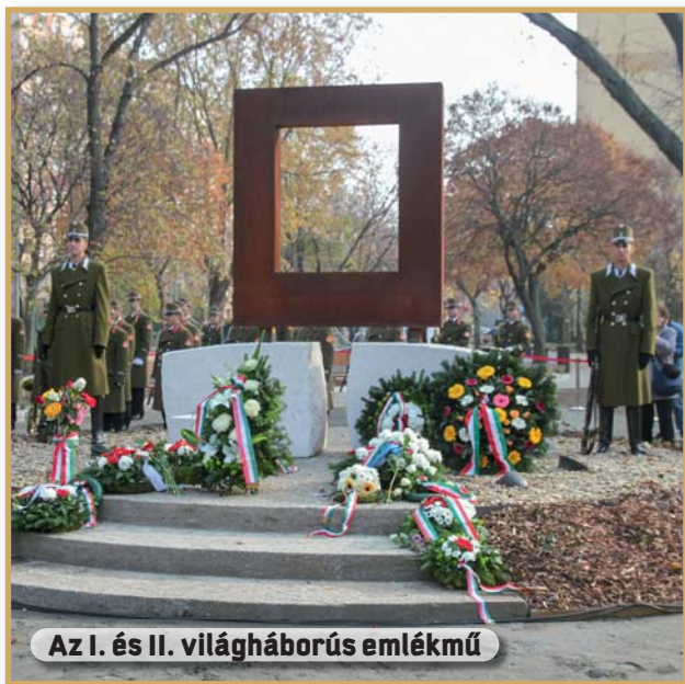
Az I. és II. világháborús emlékmű