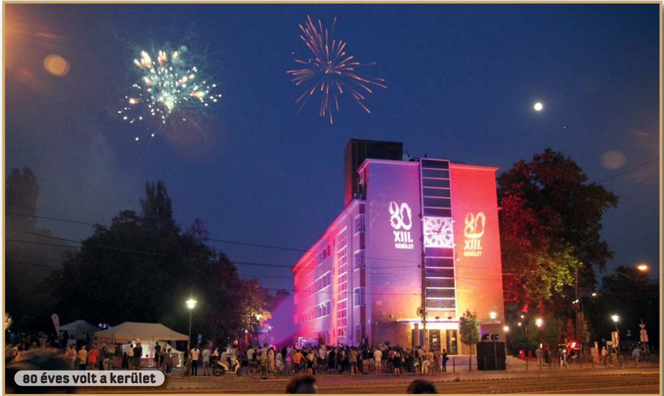
80 éves volt a kerület