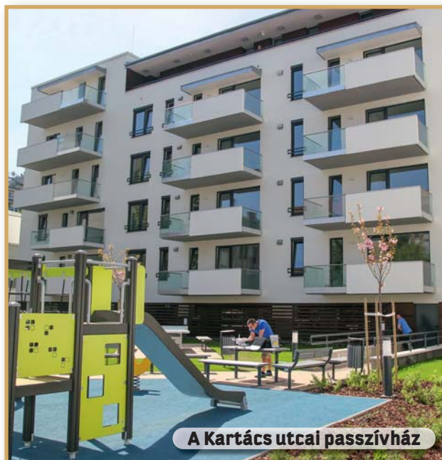
A Kartács utcai passzívház

– Miután beköltöztünk a korszerű játszótérrel, szép kerttel, világos és tágas közösségi terekkel és főleg kellemes lakással jellemezhető új házba, sokáig olyan érzésünk volt, mintha egy üdülőben lennénk... Szerencsésnek érezzük magunkat, hogy kerületünk önkormányzata elkötelezte magát a bérlakásépítés mellett, és saját tapasztalataink alapján meggyőződéses támogatói vagyunk a program folytatásának.