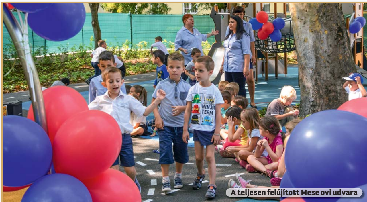
A teljesen felújított Mese ovi udvara

➤ Pályázati úton hozzájárulunk a tehetséges fiatalok tanulmányi költségeihez 1181 fő részére 51,3 millió forinttal.