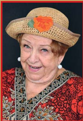
Pásztor Erzsi színművész