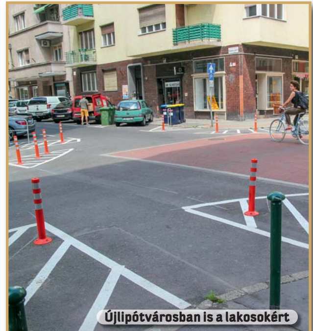
Újlipótvárosban is a lakosokért

– A XIII. kerületben több önkormányzati beruházás tervezésében vettünk részt. Minden épületünk esetében nagy segítségünkre volt az évek-re előrelátóan átgondolt, környezettudatos városfejlesztési koncepció, ami olyan úttörő energiatudatos épületek megépítését tette lehetővé, mint a 100 lakásos passzívház, vagy a Mesés-kert tagóvoda.