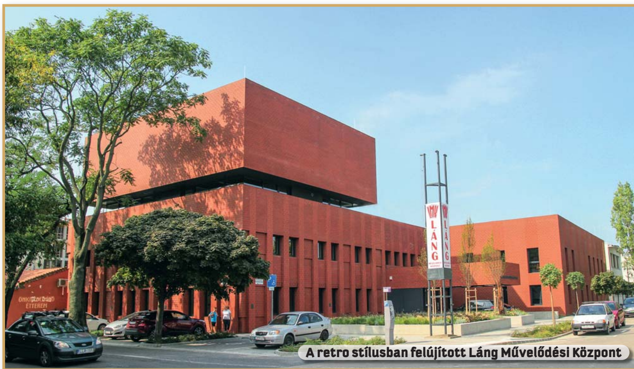
A retro stílusban felújított Láng Művelődési Központ