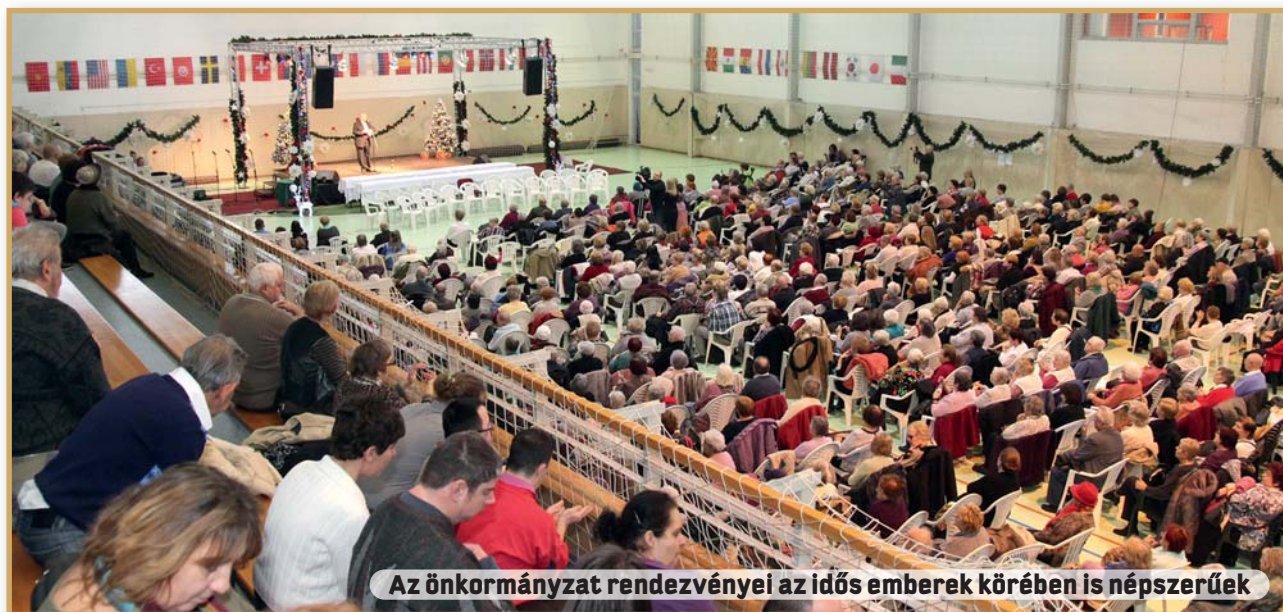
Az önkormányzat rendezvényei az idős emberek körében is népszerűek