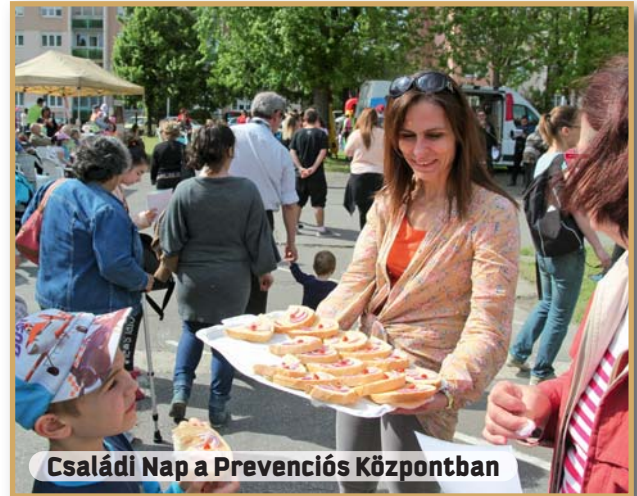
Családi Nap a Prevenációs Központban