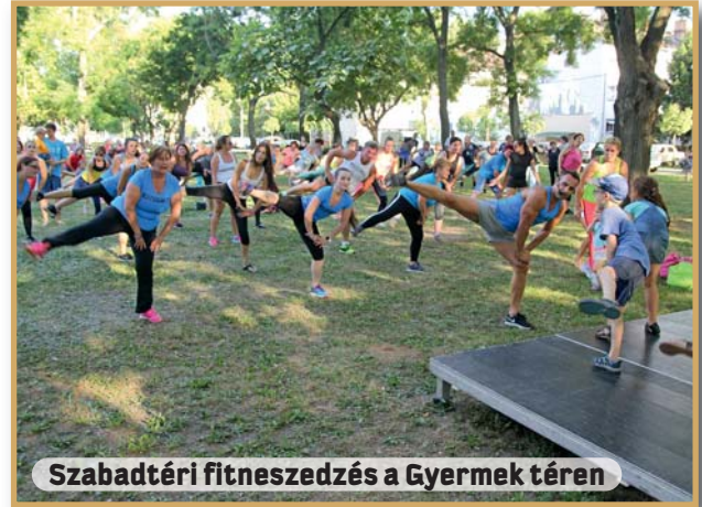
Szabadtéri fitneszedzés a Gyermek téren

Nagy öröm és megtiszteltetés számomra, hogy eredményeimmel beírhattam a nevem a XIII. kerület sporttörténetébe, ráadásul az iskolai eredményeim is javultak. Egész családom itt él, nagyon szeretem ezt a városrészt, különösen a Szent István parkot és környékét. Jó lenne, ha a következő években további sikerekkel is öregbíthetném a Honvéd és a kerület hírnevét.