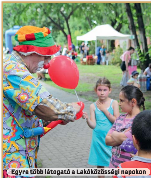
Egyre több látogató a Lakóközösségi napokon

➤ A Vakáció-akció szünidei táborunkban közel 400 gyermek a „Multikulturális színterek” keretében megismerkedhetett egyes nemzetek szokásaival, hagyományaival.