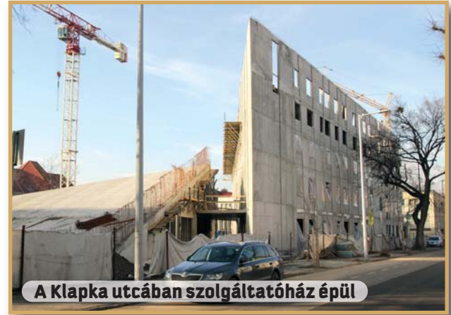
A Klapka utcában szolgáltatóház épül