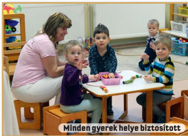
Minden gyerek helye biztosított