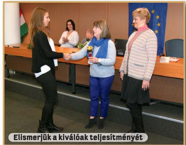
Elismerjük a kiválóak teljesítményét

Nagyon jónak tartom, hogy a kerületi önkormányzat annak ellenére folytatja a tanuló ifjúság számára évek óta megrendezett programjait, hogy az iskolák fenntartása már állami feladat. Az Éneklő Ifjúság, a Jó tanuló, jó sportoló, a Kerületi tanulmányi verseny és a többi, hasonló ifjúsági program változatlanul népszerű a pedagógusok és a diákok körében.