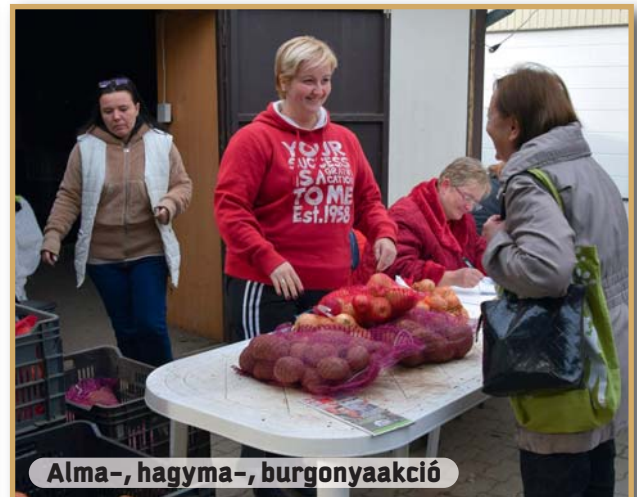
Alma-, hagyma-, burgonyaakció

Munkatársaimmal nagyon meglepődtünk, amikor megtudtuk, hogy a vásárlók szavazatai alapján mi nyertük el a kerület legjobb üzletének elismerésére szolgáló, az önkormányzat által alapított díjat, amelynek átvétele egybeesett a bolt korszerűsítésének befejezésével. A kitüntetés hírére növekedett a forgalmunk, gyarapodott a törzsvásárlók köre.