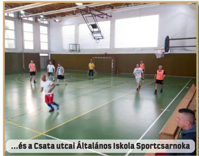
...és a Csata utcai Általános Iskola Sportcsarnoka

➤ A bíróság önkormányzatunknak adott igazat: társasházi ingatlaná alakíthatók az iskolai épületek. Az önkormányzaté maradt a Csata utcai Általános Iskola Sportcsarnoka, a Németh László Gimnázium és a Herman Ottó Tagiskola tanuszodája, a Prizma EGYMI épület egy része.