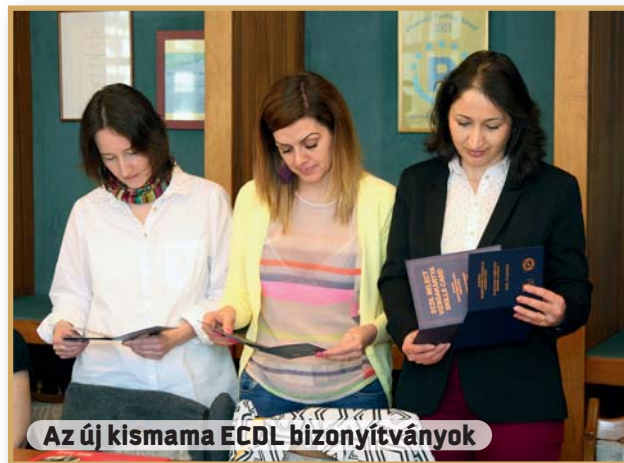
Az új kismama ECDL bizonyítványok

Nagy örömeinkre szolgált, hogy az önkormányzat lehetővé tette a térítési díj elektronikus úton történő befizetését. Ezzel sok kellemtelenségtől szabadultunk meg, nem okoz gondot a befizetés határidejének betartása, és egy pillanat alatt eleget tudunk tenni a befizetési kötelezettségünknek. Látványosan nem nagy ügyről van szó, de az ilyen apróságok is hozzájárulnak a hétköznapi életünk jobbá válásához.