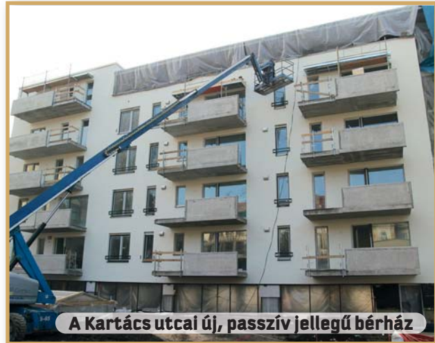
A Kartács utcai új, passzív jellegű bérház

Az elmúlt két esztendőben 2-2 társasház felújításához nyertünk pályázati támogatást az önkormányzattól. Ennek révén igazi építészeti értékeket sikerült megóvnunk a pusztulástól: homlokzatok, felvonók, erkélyek és függőfolyosók felújítására kerülhetett sor. A kerületben járva mindenki láthatja, hogy a felújítások támogatására biztosított pénz jól hasznosul.