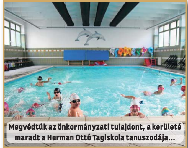
Megvédtük az önkormányzati tulajdont, a kerületé maradt a Herman Ottó Tagiskola tanuszodája...

Tapasztalataim szerint a kerület lakossága örömmel fogadta, hogy az iskolák államosítása ellenére az önkormányzat talált módot a városrész tanuszodáinak „mentésére”, és az önkormányzat által történő további üzemeltetésére. Így biztosított a létesítmények optimális és gazdaságos kihasználása, és attól sem kell tartani, hogy forrás hiányában elmaradnának a szükséges karbantartások és felújítások.