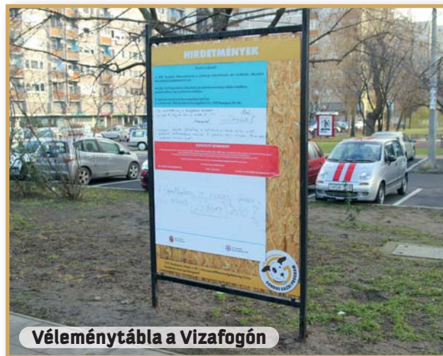
Véleménytábla a Vízafogón